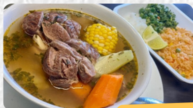
CALDO DE RES